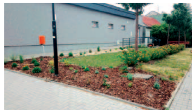
Vizualizace kvetoucího záhonu před Jednotou (Slovák, 2016)

bude spojen pouze a jen s něčím nehmatatelným, krásně šakvickým.