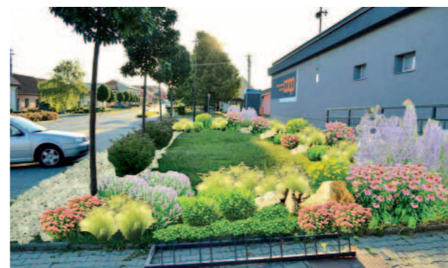
Vizualizace kvetoucího záhonu před Jednotou (Slovák, 2016)